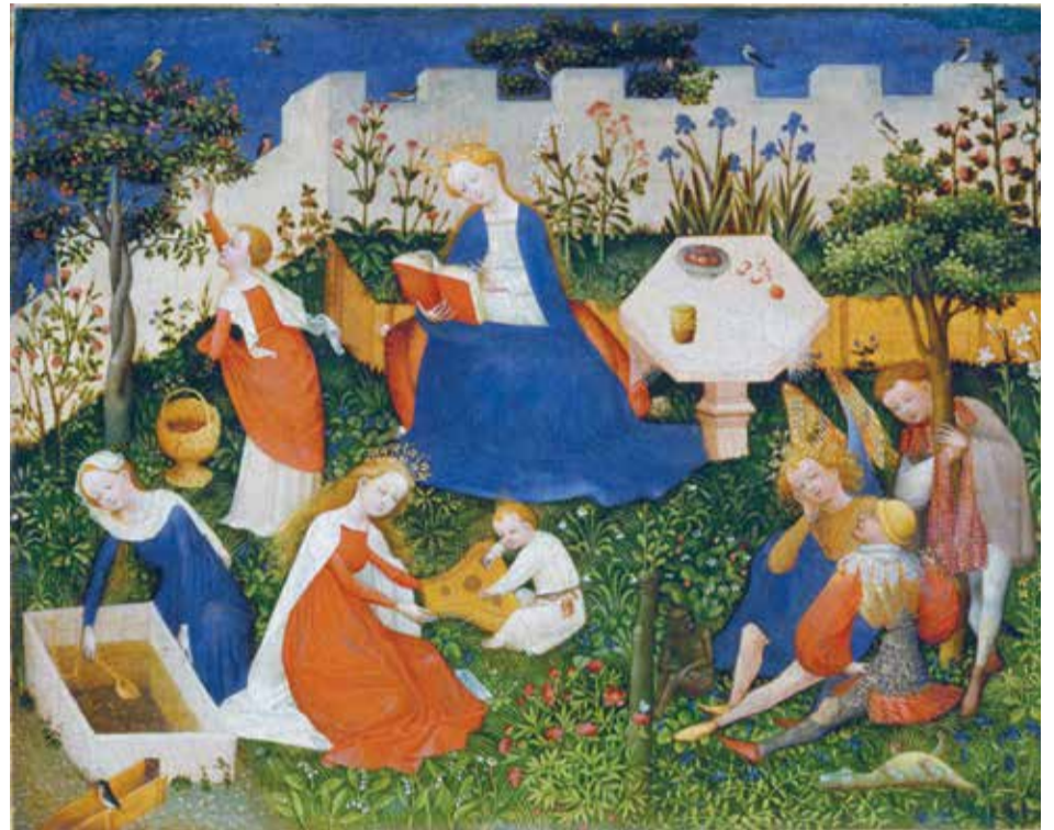
Het Paradijstuinje, onbekende meester, ca. 1413.

Meer lezen? Het Frankfurter Paradijstuinje , Eva Mees-Christeller, ABC Wegwijzer 10, ISBN 90 73310 52 0